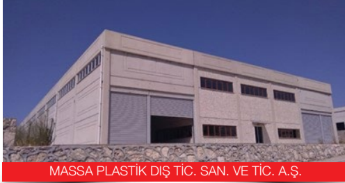
MASSA PLASTİK DIŞ TİC. SAN. VE TİC. A.Ş.