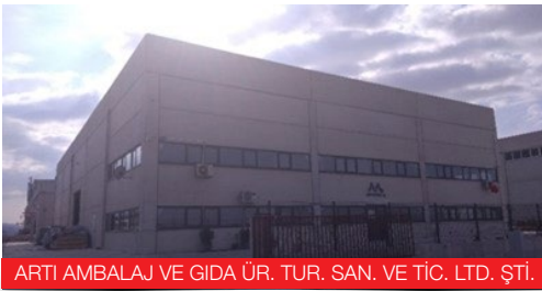
ARTI AMBALAJ VE GIDA ÜR. TUR. SAN. VE TİC. LTD. ŞTİ.