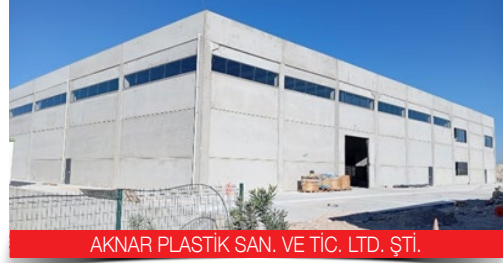
AKNAR PLASTİK SAN. VE TİC. LTD. ŞTİ.