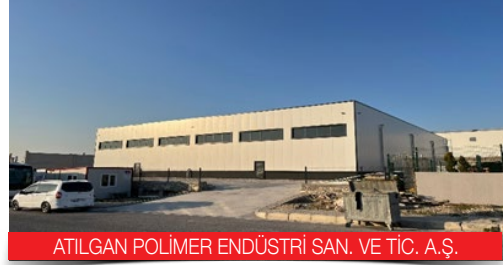
ATILGAN POLİMER ENDÜSTRİ SAN. VE TİC. A.Ş.