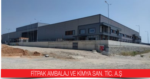
FİTPAK AMBALAJ VE KİMYA SAN. TİC. A.Ş.