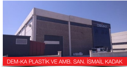
DEM-KA PLASTİK VE AMB. SAN. İSMAİL KADAK