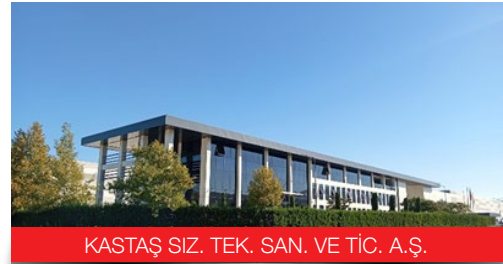
KASTAŞ SİZ. TEK. SAN. VE TİC. A.Ş.