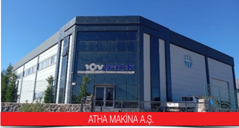
ATHA MAKİNA A.Ş.