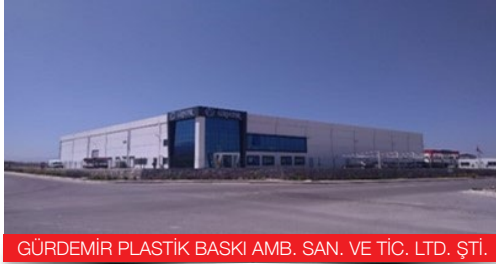
GÜRDEMİR PLASTİK BASKI AMB. SAN. VE TİC. LTD. ŞTİ.