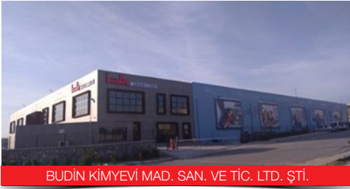
BUDİN KİMYEVİ MAD. SAN. VE TİC. LTD. ŞTİ.