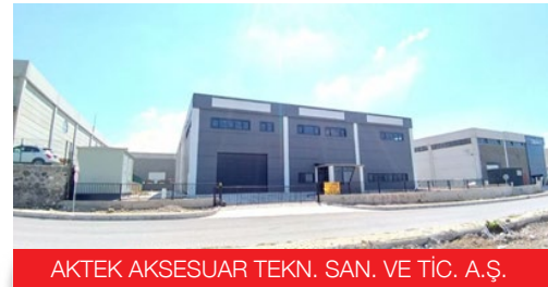
AKTEK AKSESUAR TEKN. SAN. VE TİC. A.Ş.