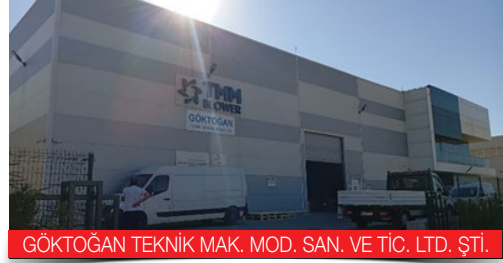
GÖKTOĞAN TEKNİK MAK. MOD. SAN. VE TİC. LTD. ŞTİ.