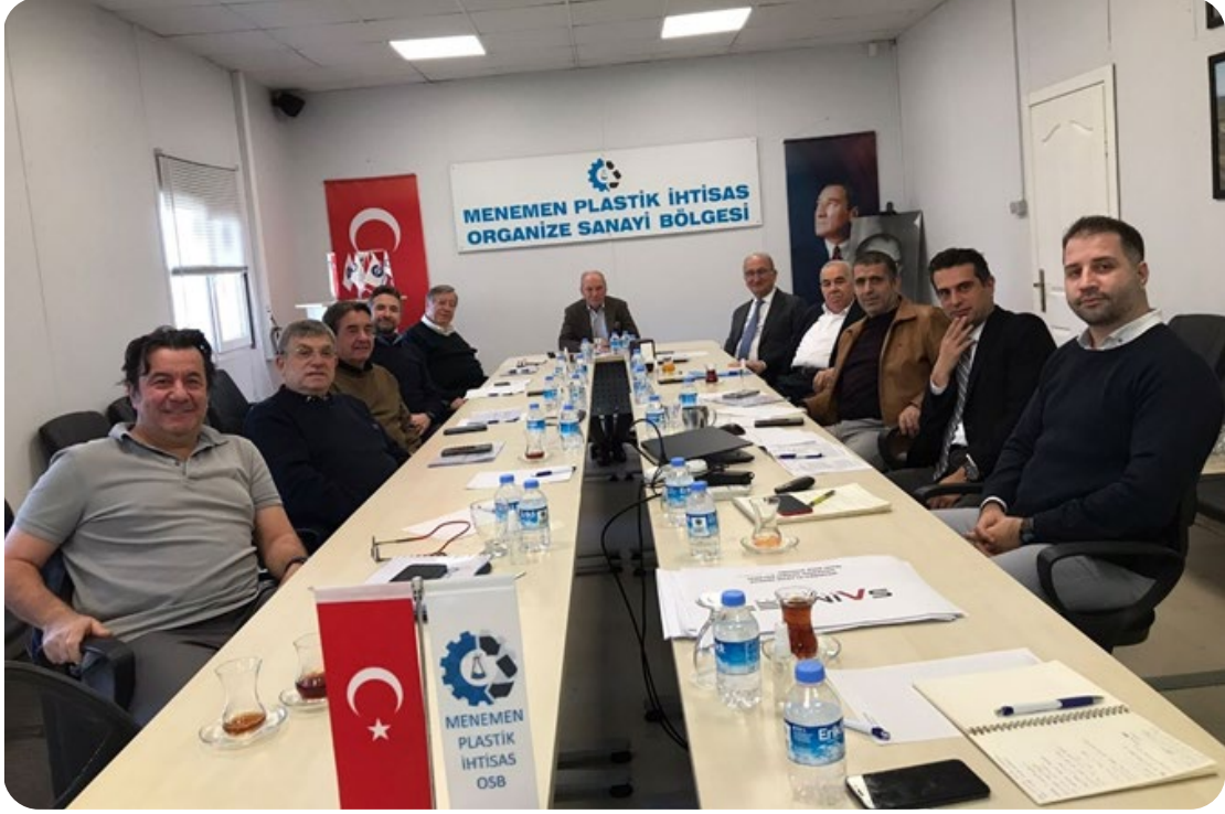
Yönetim Kurulu Toplantısı 17.12.2024

■ Ekim – Kasım – Aralık dönemi Yönetim Kurulu toplantılarımız Denetim Kurulu Üyelerimizin de katılımı ile yapılmış olup, Bölgemiz gündeminde yer alan konular görüşülerek karara bağlanmıştır.