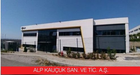
ALP KAUÇUK SAN. VE TİC. A.Ş.