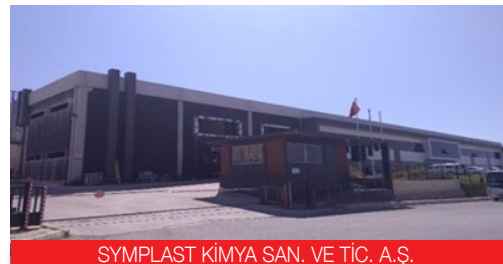
SYMPLAST KİMYA SAN. VE TİC. A.Ş.