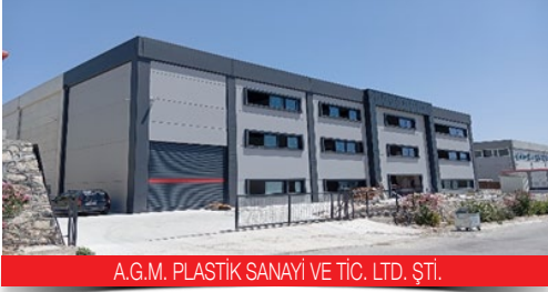
A.G.M. PLASTİK SANAYİ VE TİC. LTD. ŞTİ.