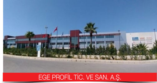
EGE PROFİL TİC. VE SAN. A.Ş.