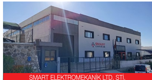
SMART ELEKTROMEKANİK LTD. ŞTİ.