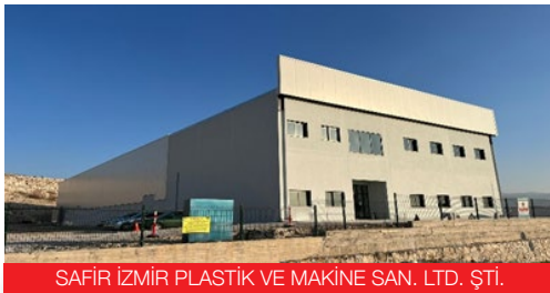
SAFİR İZMİR PLASTİK VE MAKİNE SAN. LTD. ŞTİ.