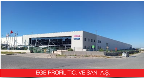
EGE PROFİL TİC. VE SAN. A.Ş.