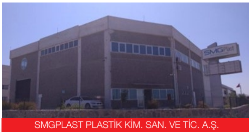
SMGPLAST PLASTİK KİM. SAN. VE TİC. A.Ş.