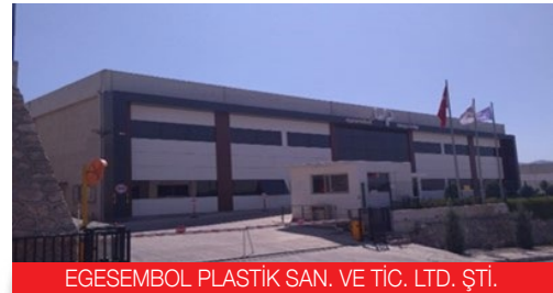
EGESEMBO PLASTİK SAN. VE TİC. LTD. ŞTİ.