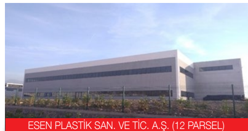
ESEN PLASTİK SAN. VE TİC. A.Ş. (12 PARSEL)