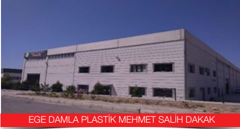
EGE DAMLA PLASTİK MEHMET SALİH DAKAK