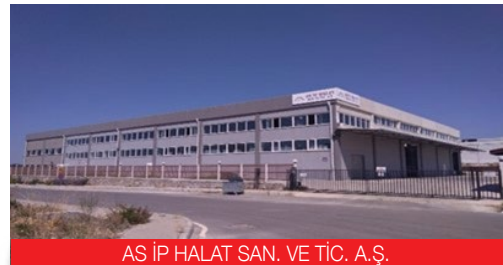
AS İP HALAT SAN. VE TİC. A.Ş.