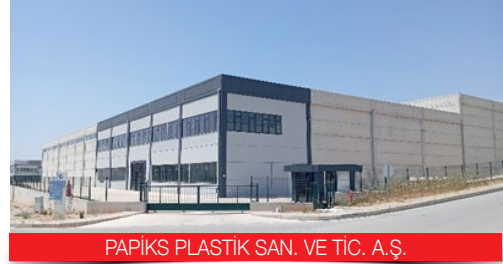
PAPİKS PLASTİK SAN. VE TİC. A.Ş.