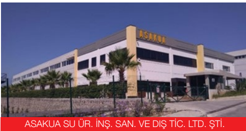
ASAKUA SU ÜR. İNŞ. SAN. VE DİŞ TİC. LTD. ŞTİ.