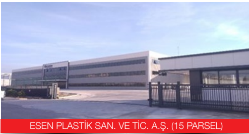
ESEN PLASTİK SAN. VE TİC. A.Ş. (15 PARSEL)