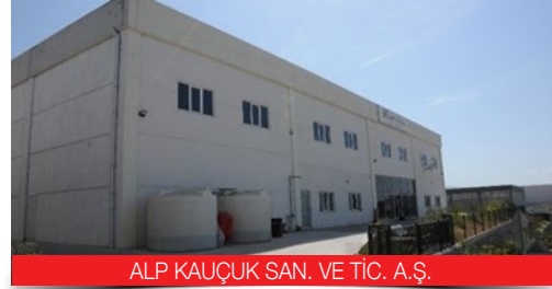
ALP KAUÇUK SAN. VE TİC. A.Ş.