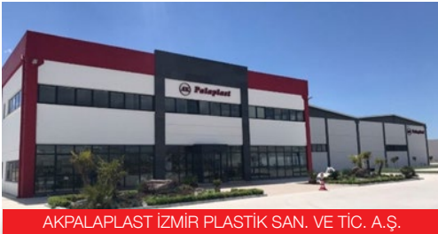
AKPALAPLAST İZMİR PLASTİK SAN. VE TİC. A.Ş.