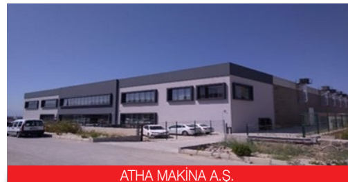
ATHA MAKİNA A.Ş.