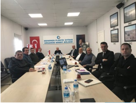
Yönetim Kurulu Toplantısı 16.01.2024