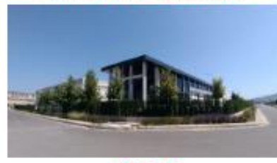
KASTAŞ SIZDIRMAZLIK TEK. SAN. VE TİC.