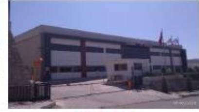
EGESEMBOL PLASTİK SAN. VE TİC. LTD. ŞTİ.