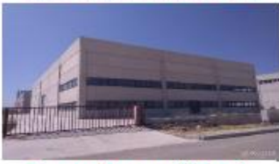
İNTERYAĞ PETROL ÜRÜNLERİ SAN. TİC. LTD. ŞTİ.