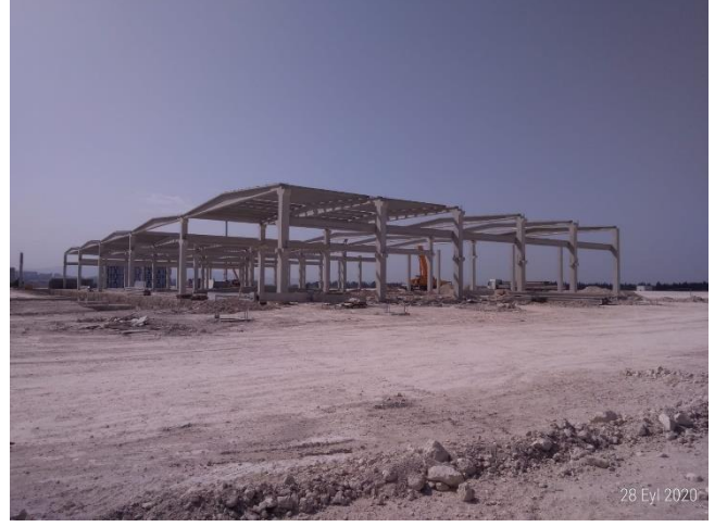
ESEN PLASTİK SAN. VE TİC. A.Ş. (12 PARSEL)