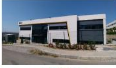
ALP KAÜÇUK SAN. VE TİC. A.Ş.