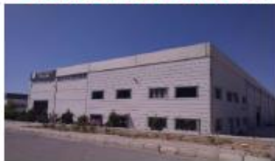
SMGPLAST PLAS. KİM. SAN. VE TİC. A.Ş.