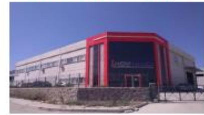
İNOVPACK MAK. AMB. SAN. VE TİC. A.Ş.