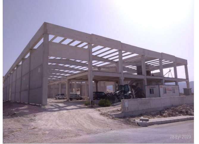
İZ MEKANİK MAK. KONS. DÖK. SAN. VE TİC. A.Ş.