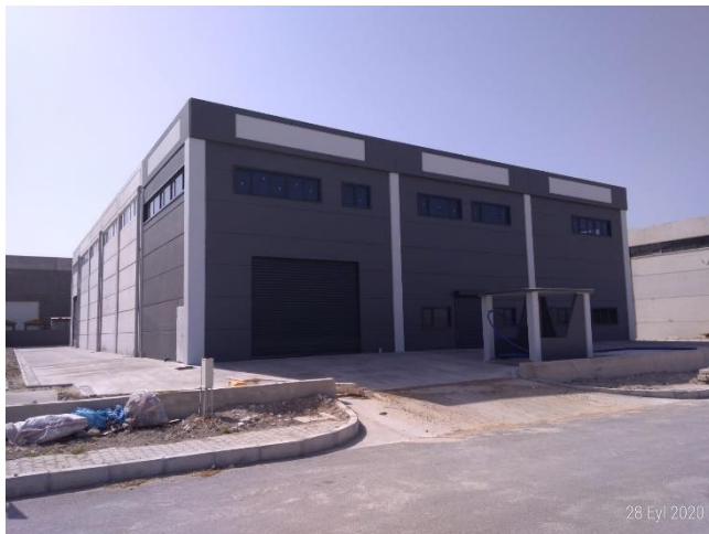
PLSMAN SAN. VE TİC. LTD. ŞTİ.A.Ş.