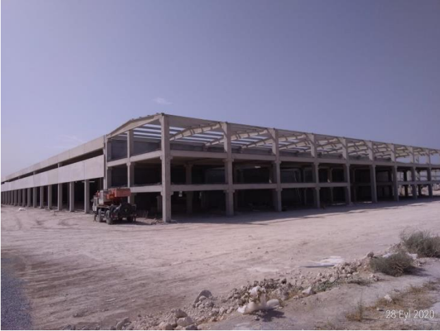
ESEN PLASTİK SAN. VE TİC. A.Ş. (15 PARSEL)