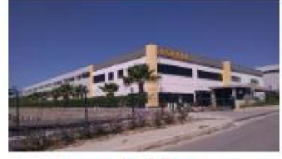
ASAKUA SU ÜR. İNŞ. SAN. VE DİŞ TİC. LTD.