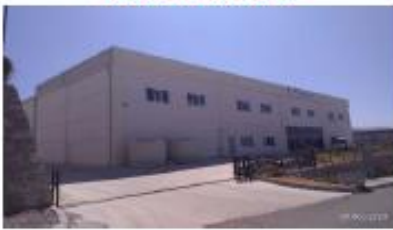
METE ENERJİ A.Ş.