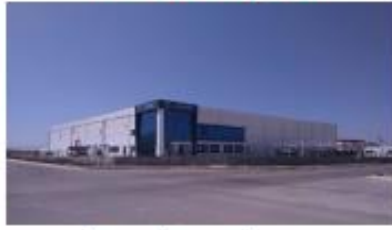
GÜRDEMİR PLASTİK BASKI AMB. SAN. VE TİC. LTD. ŞTİ.