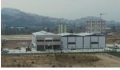
AK PALAPLAST İZMİR A.Ş.