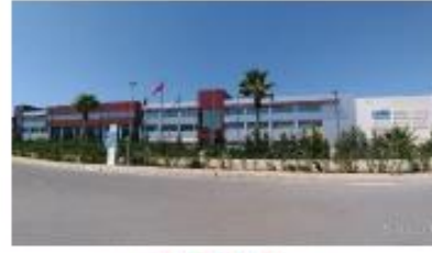
EGE PROFİL TİC. VE SAN. A.Ş. ŞTİ.