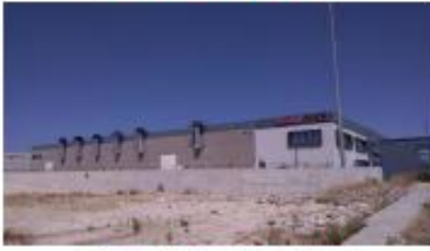
GÖKTOĞAN TEKNİK MAK. MOD. SAN. VE TİC. LTD. ŞTİ.ŞTİ.