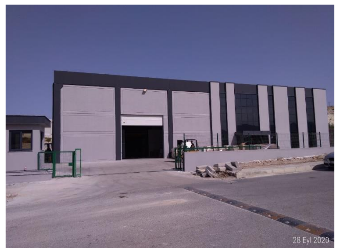
VKF RENZEL SALES PROM. İMA. VE TİC. LTD. ŞTİ.