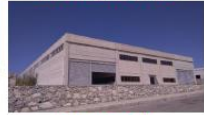
MEDUSA PLASTİK KOMP. İNŞ. SAN. VE TİC. LTD. ŞTİ.