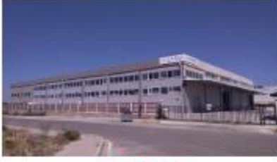
AS İP HALAT SAN. VE TİC. A.Ş.