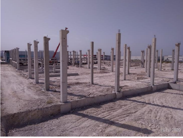
BUDİN KİMYEVİ MADDELER SAN. VE TİC. LTD. ŞTİ.