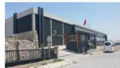
SYMPLAST KİMYA SAN. VE TİC. A.Ş.